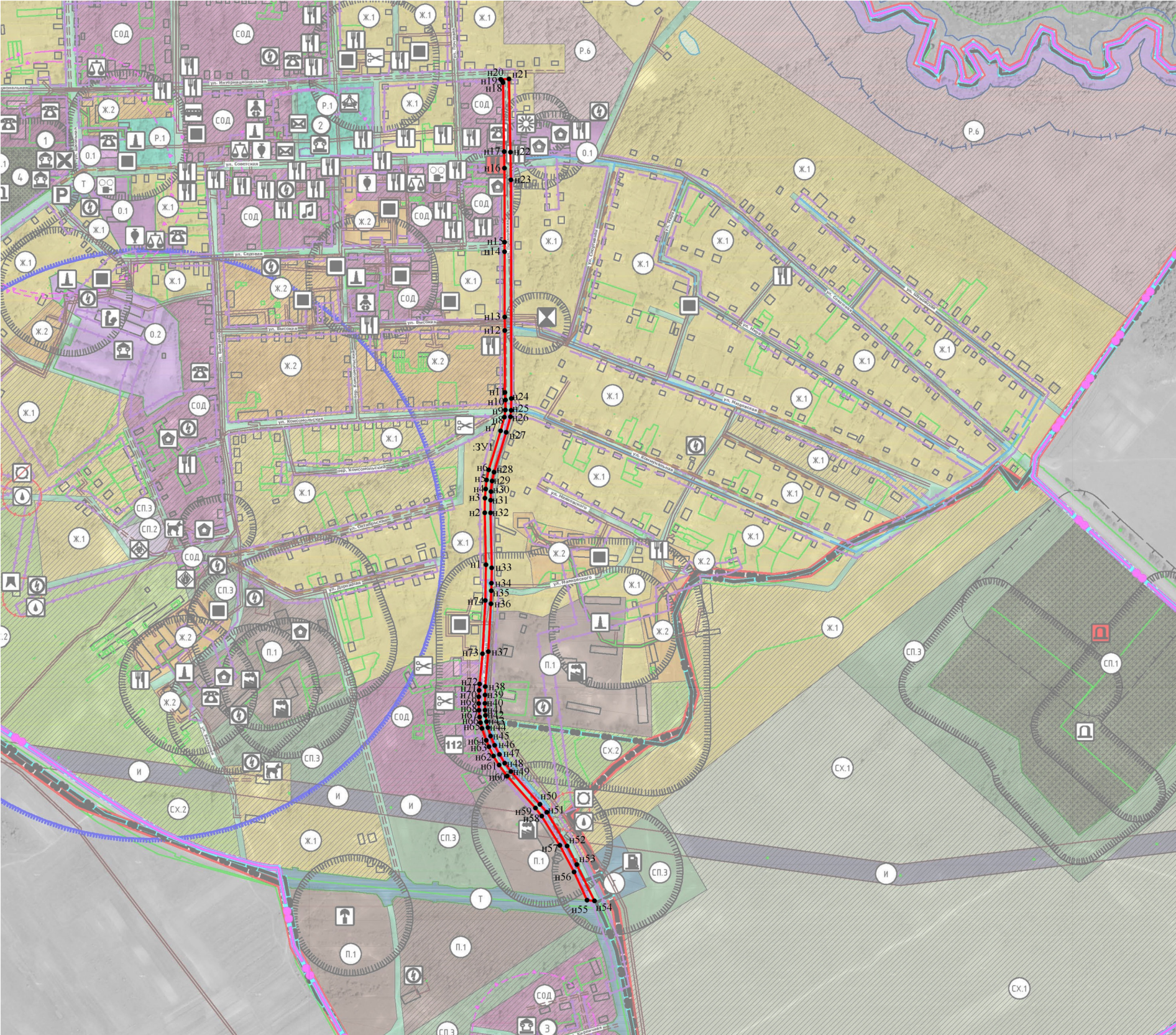
Масштаб 1:8 000

Улично - дорожной сети расположенной по адресу: Российская Федерация, Смоленская область, Шумячский район, п. Шумячи, ул. Понятовская