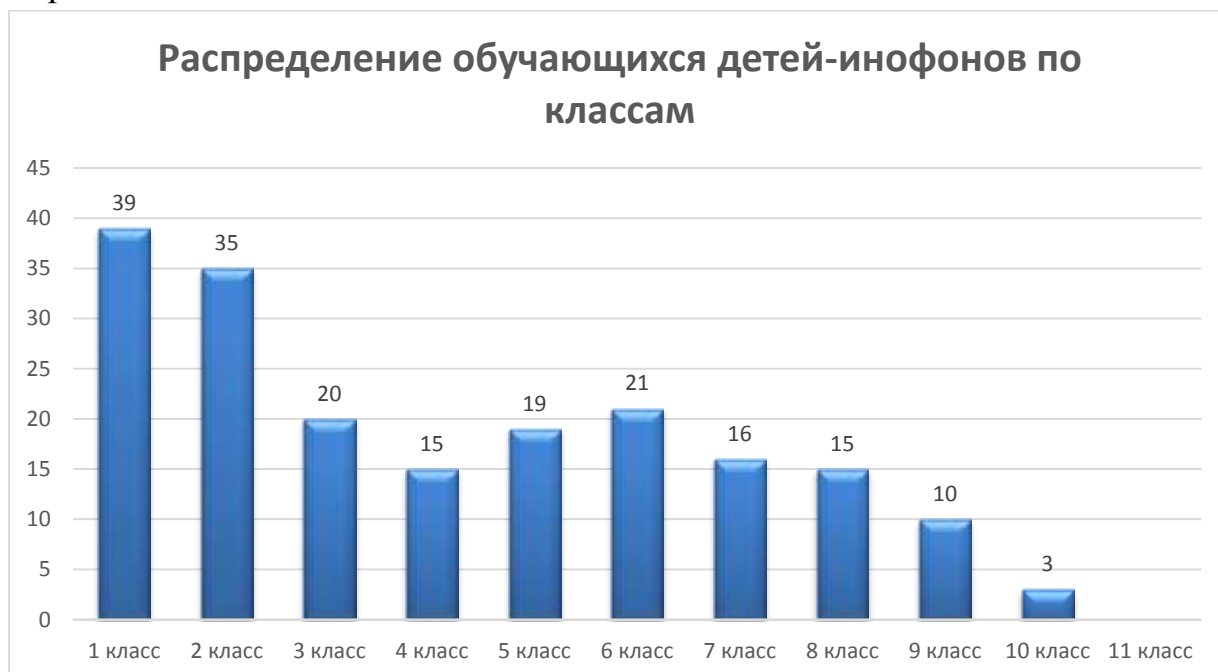
Диаграмма 2. Распределение общего количества обучающихся детей-инофонов по классам

Распределение обучающихся детей-инофонов по классам представлено на диаграмме 2.